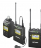
UWP-D16 UWP-D-Funkmikrofonpaket mit XLR-Anstecksender