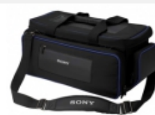
LCS-G1BP Transporttasche (weich)