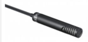
ECM-MS2 Kompaktes Elektretkondensatormikrofon