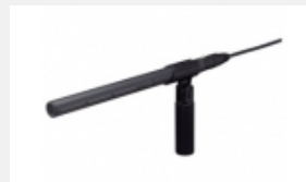
ECM-678 Elektret-Kondensator- Mikrofon im Shotgun-Design