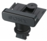
SMAD-P3 MI-Schuhadapter (Multi Interface) für einen kabellosen Anschluss