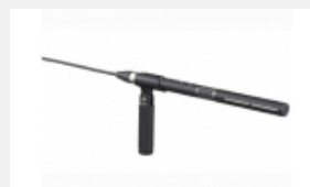
ECM-680S Shotgun-Elektret- Kondensator-Stereomikrofon