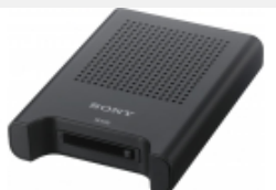
SBAC-US30 Lese-/Schreibegerät für SxS PRO+ und SxS- 1 Festspeichermedien über USB 3.0