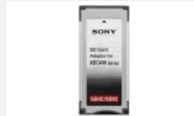
MEAD-SD02 SD Card™-Adapter für XDCAM EX-Produkte