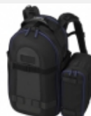
LCS-BP1BP Weiche Transporttasche