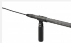
ECM-673 Kurzes Elektret-Kondensator- Mikrofon im Shotgun-Design