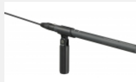
ECM-674 Günstiges Elektret- Kondensator-Mikrofon im Shotgun-Design