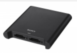
SBAC-UT100 Lese-/Schreibegerät mit zwei Steckplätzen für SxS PRO+ und SxS- 1 Festspeicherkarten sowie Thunderbolt-2- und USB-3.0- Schnittstellen