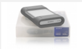
PSZ-HA50 500 GB Festplatte