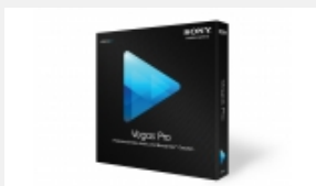
Vegas Pro 12 Professionelle Erstellung von Video, Audio und Blu-ray Disc™