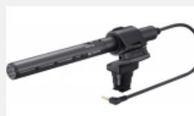
ECM-CG50BP Shotgun-Elektret- Kondensator-Mikrofon mit Supernierencharakteristik