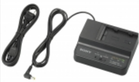
BC-U1 Akkuladegerät/Netzteil für die Lithium-Ionen-Akkus BP- U90/U60/U30