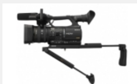
VCT-SP2BP Multifunktionale Camcorder-Schulterstütze