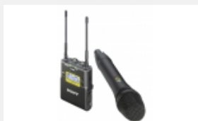
UWP-D12 UWP-D-Funkmikrofonpaket mit Handsender