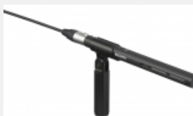
ECM-VG1 Elektret-Kondensator-Mikrofon im Shotgun-Design