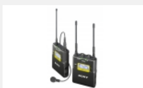
UWP-D11 UWP-D-Funkmikrofonpaket mit Gürtelsender