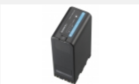
BP-U90 Lithium-Ionen-Akku (85 Wh)