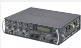
DMX-P01 Tragbares digitales Audiomischpult