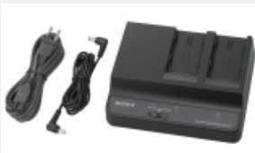
BC-U2 Zweikanal- Akkuladegerät/Netzteil für die Lithium-Ionen-Akkus BP- U90/U60/U30